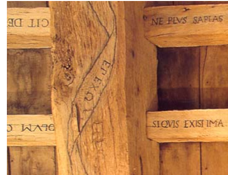
Patrimoine culturel Monuments Historiques

ENSCP, Chem'innov 16 avenue Pey Berland 33607 Pessac Cedex France